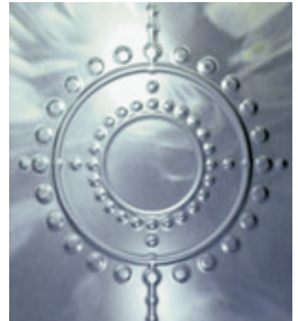
Metall (Silber, Weiß)

Alles was uns umgibt, läßt sich den Fünf Elementen zuordnen.