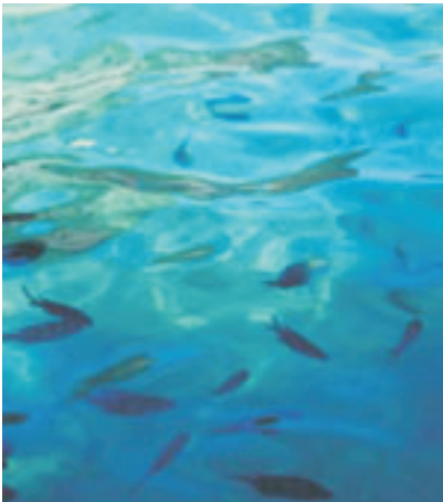
Wasser (Dunkelblau, Schwarz)